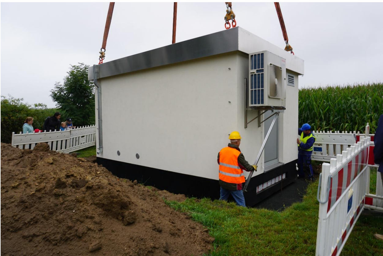
selbst zukünftige Nutzer des Breitbandnetzes aus der Altmark bestaunten das Spektakel in der Luft und bei der Baugrube