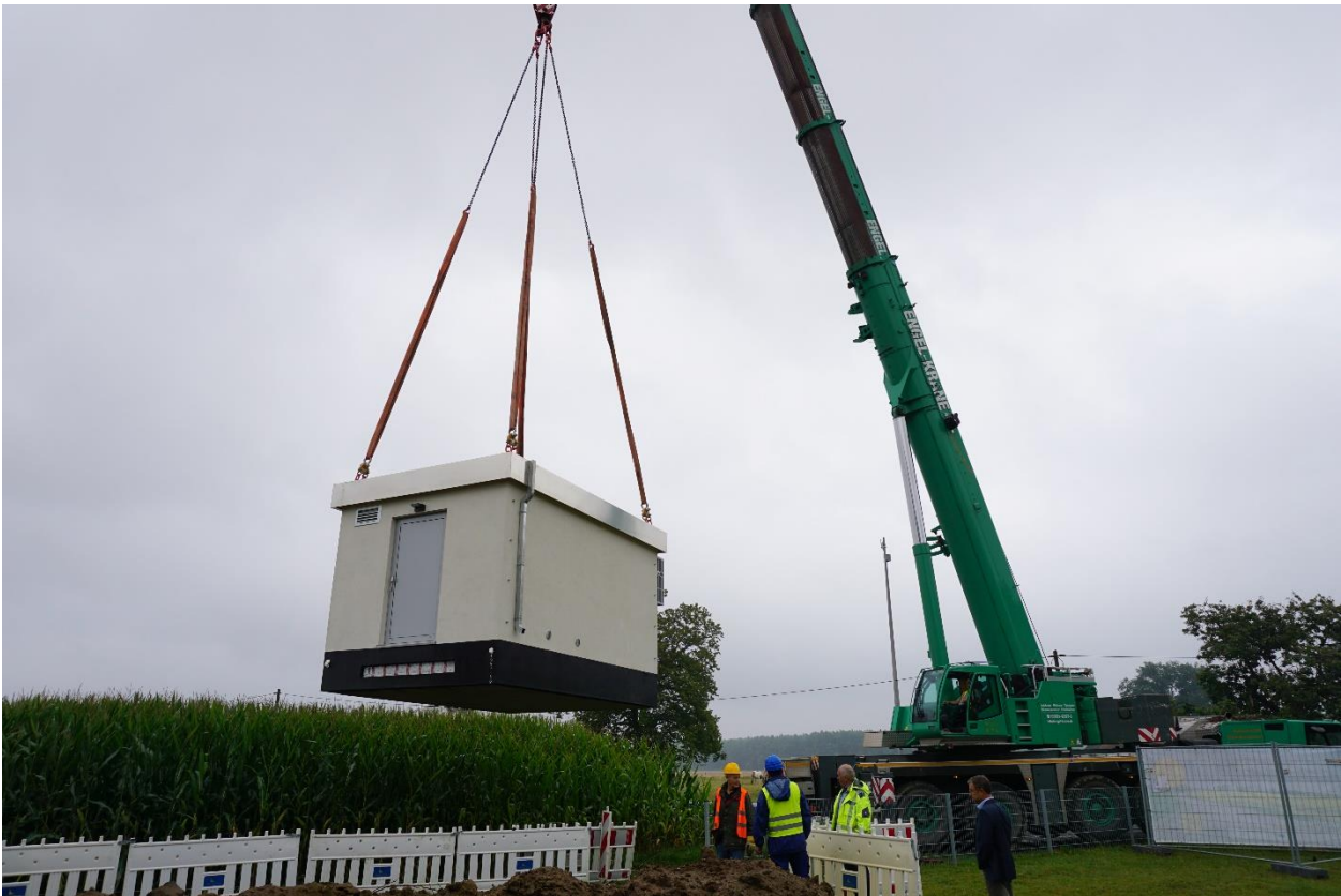
der PoP-Container schwebt über dem Maisfeld in Haselhorst