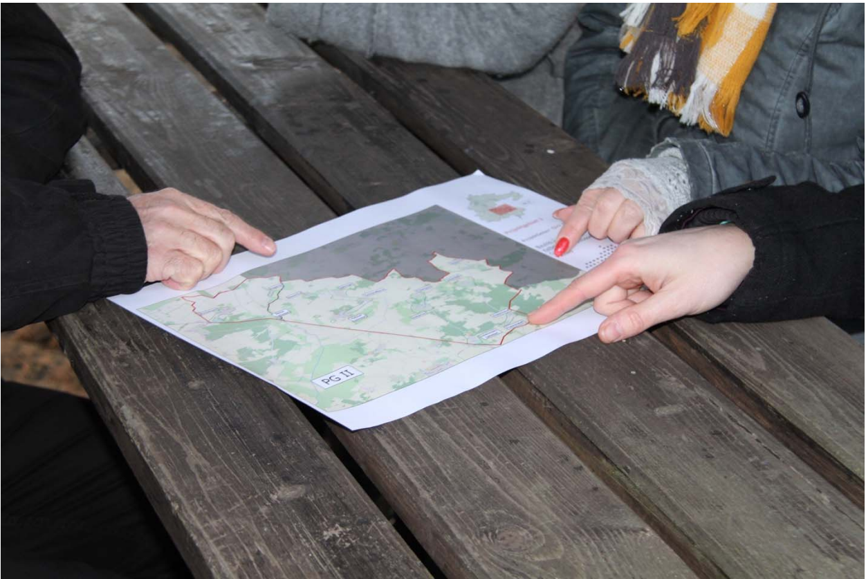
Abbildung 3 LOS 1 – Bismark Nordost Kalbe Nordost